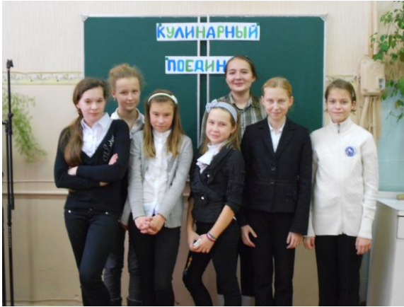
6 в класс- «Дружба» - 1 место